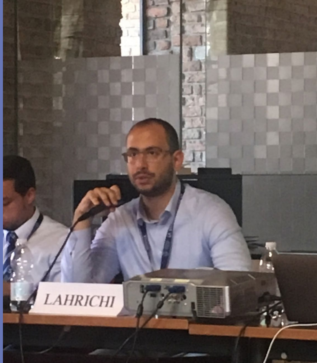
Omar Lahrichi , « Un État de droit inachevé au Maroc : quelles implications pour la démocratisation et la garantie des droits fondamentaux ? », Université lumière Lyon II