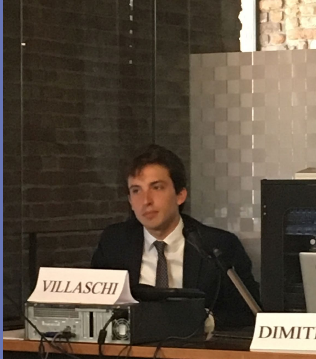
Pietro Villaschi , « La crisi della legge e la proliferazione della decretazione d'urgenza: problematiche e prospettive », Università de Milan