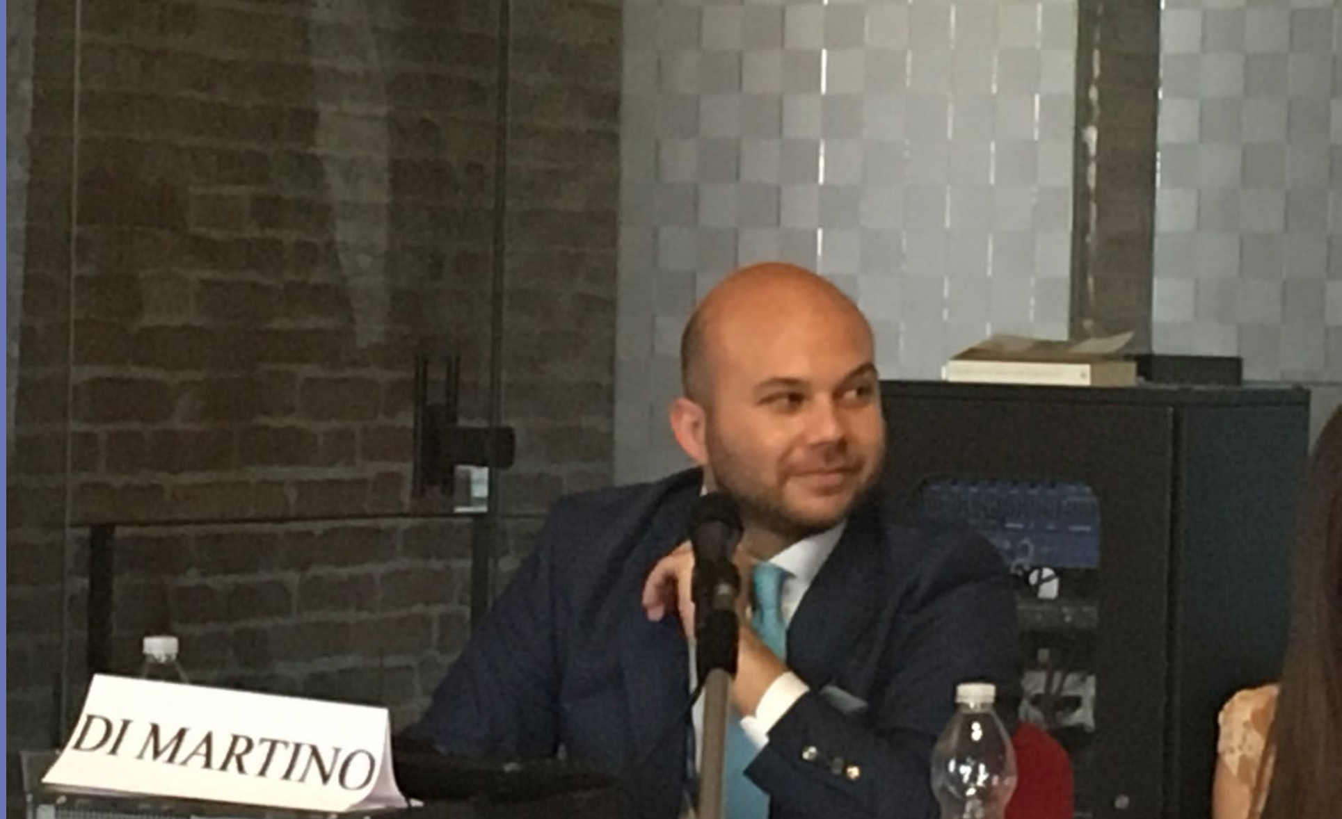
Alessandro Di Martino , « Stato di diritto e sicurezza giuridica nello spazio giuridico sovranazionale: l'amministrazione a conformazione europea tra giurisprudenza nomopoietica e necessarietà della codificazione del procedimento amministrativo europeo », Université de Naples « federico II »