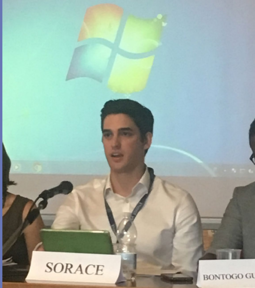
Francesco Sorace , «The Achmea Decision: Between Fragmentation and Constitutionalization », Université de Milan