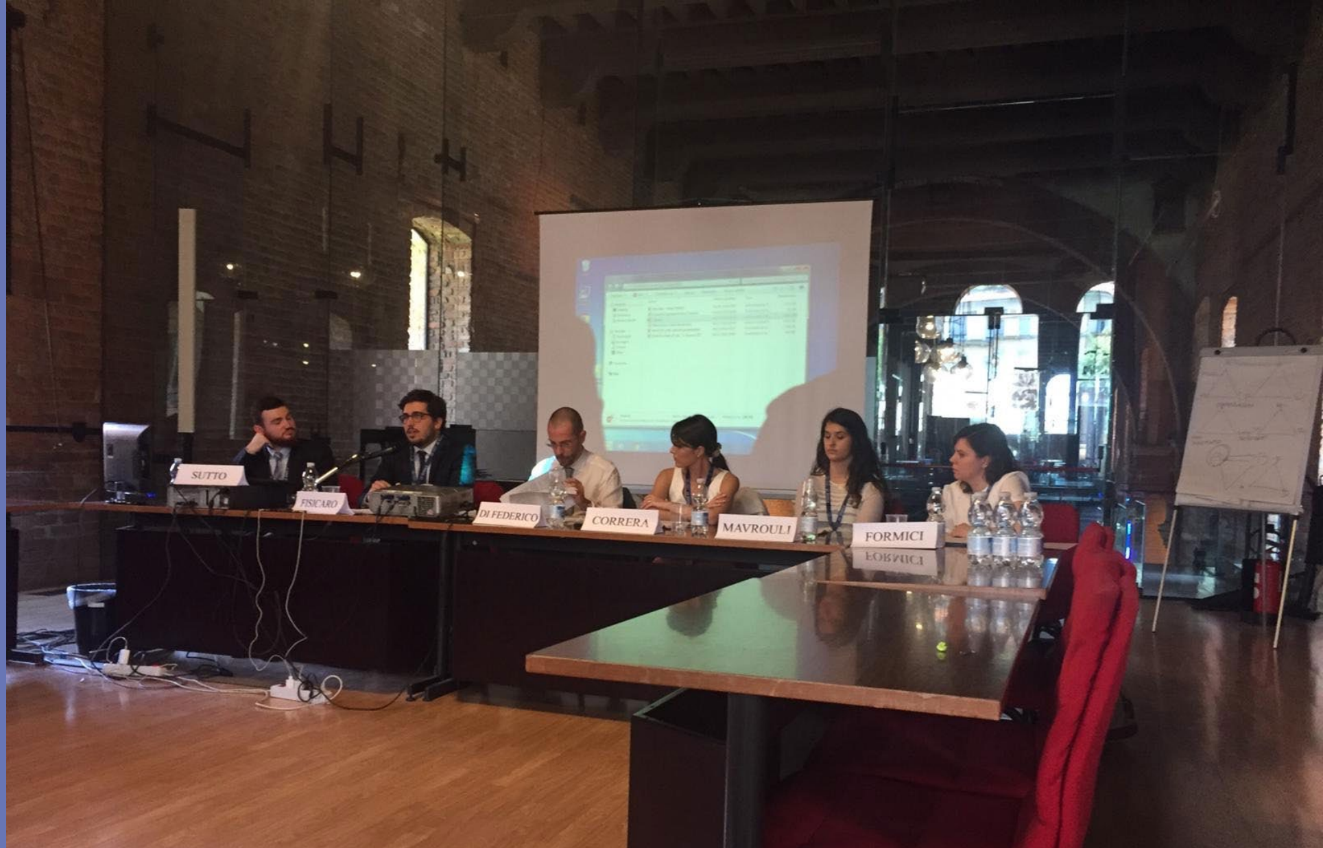
Deuxième session sur La dimension interne et externe de l'État de droit dans le droit de l'Union européenne , présidée par Giacomo Di Federico , professeur à l'Université de Bologne