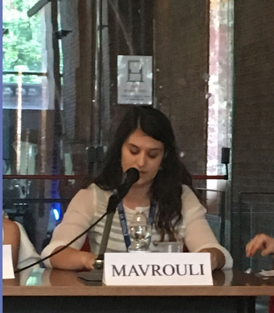
Roila Mavrouli , « L'État de droit dans l'époque de gouvernance européenne et de migration : déroger aux droits fondamentaux ? », Université du Luxembourg et Université de Nanterre