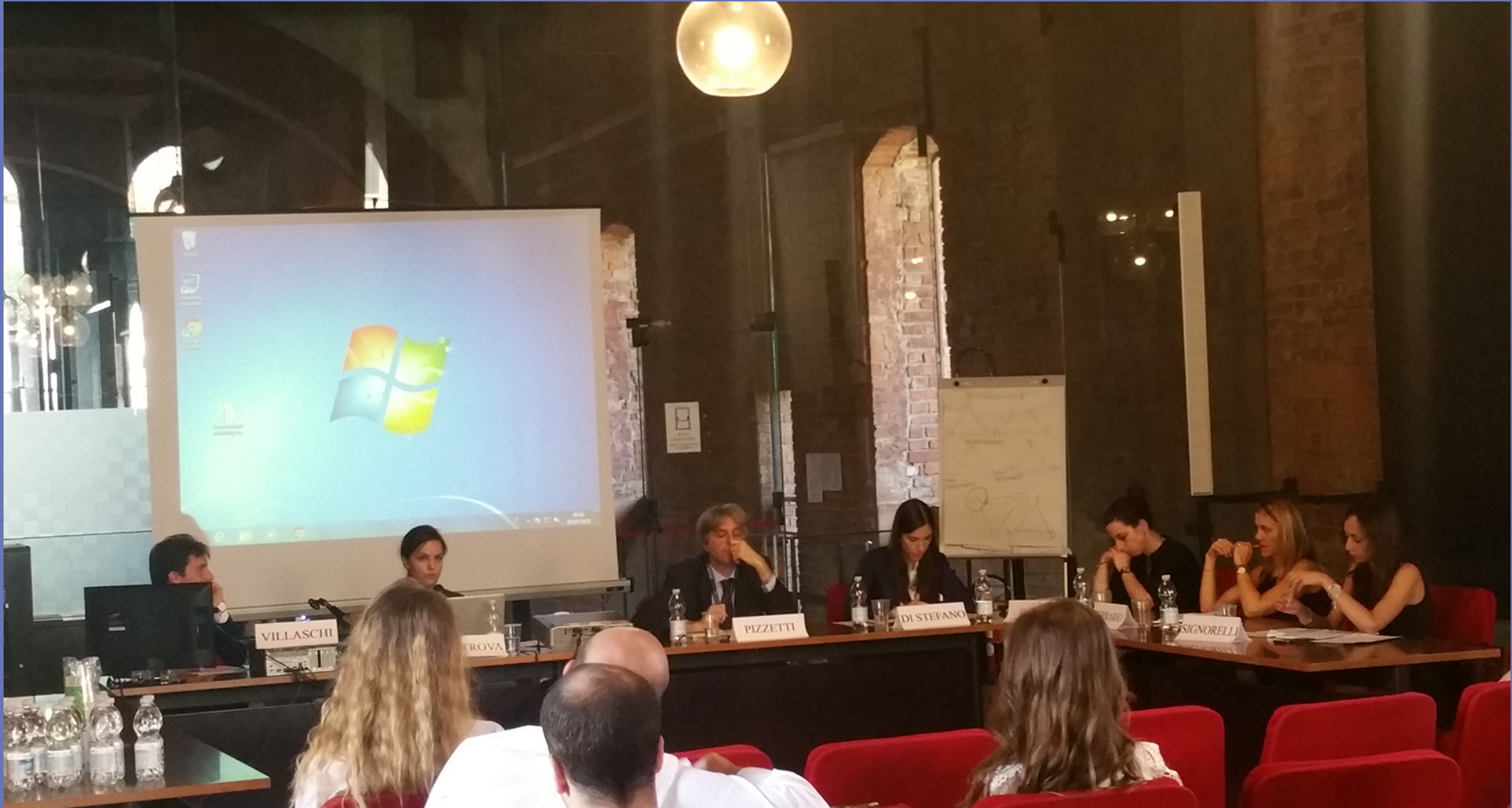
Quatrième session sur La crise de l'État de droit à travers les conflits de pouvoir , présidée par Federico Gustavo Pizzetti , professeur à l'Université de Milan