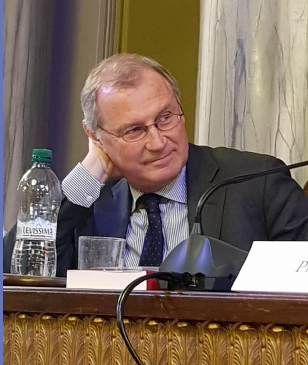
Discours d'introduction par Nicolò Zanon , juge constitutionnel