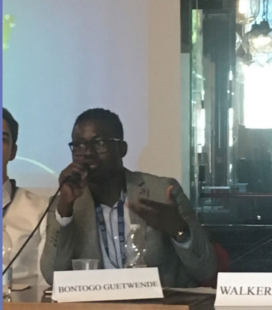
Lionnel Bontogo Guetwende , « L'État de droit dans le processus de consolidation démocratique au Sahel face aux enjeux sécuritaires », Université Clermont Auvergne