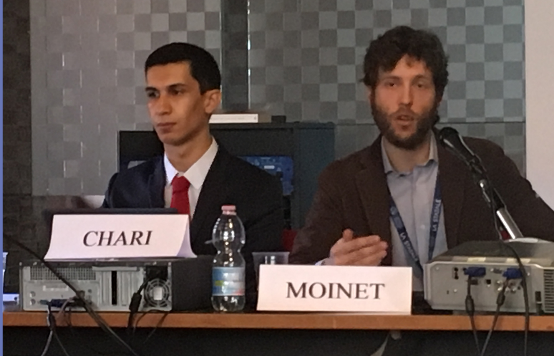
Jean-Paul Moinet , « The International Rule of Law Challenged: A Legal Analysis of the Approach of the UN Security Council to Western Sahara », Université de Trente