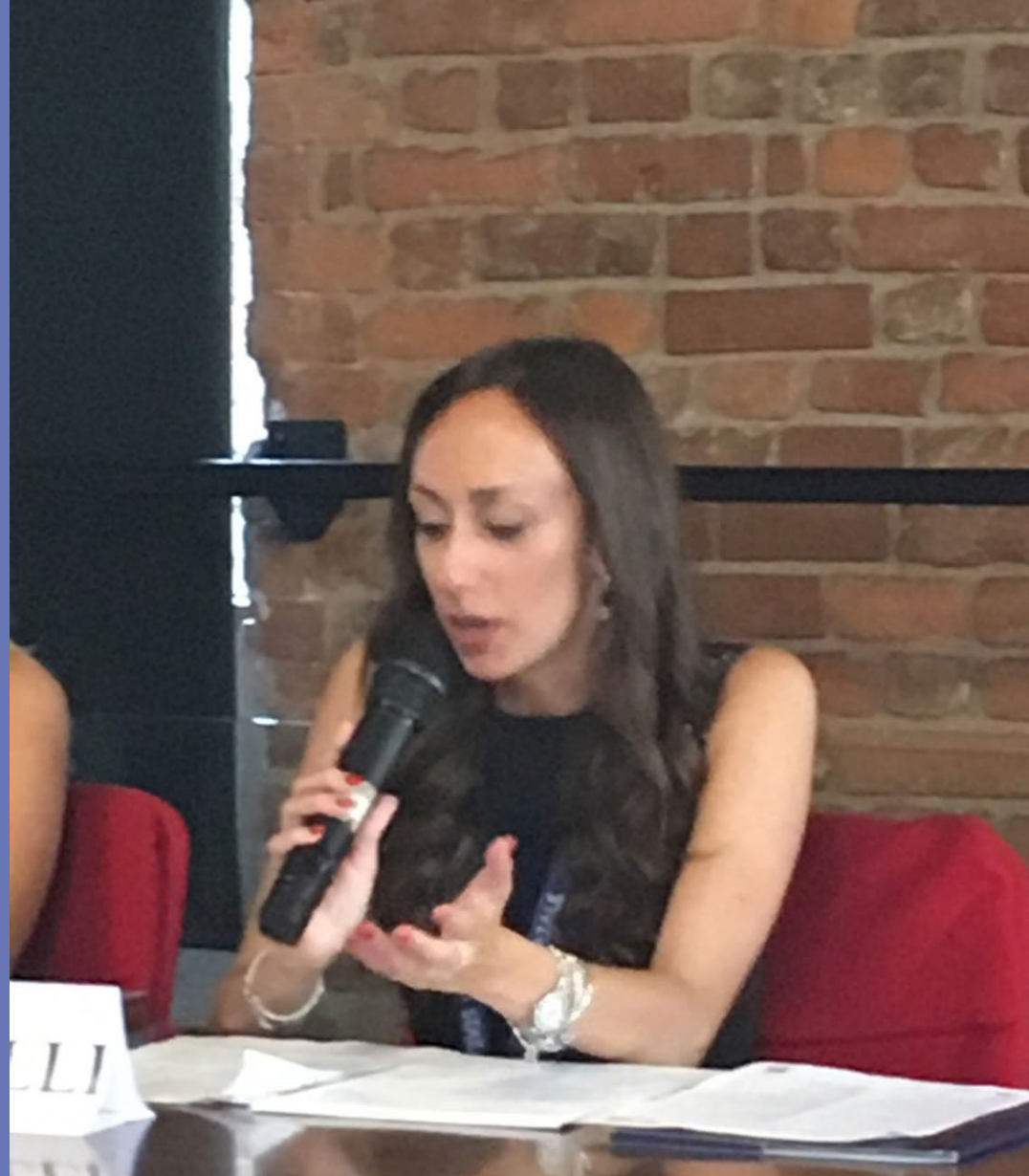
Annalisa Signorelli , « Attivismo giudiziario tra diritti fondamentali e sicurezza giuridica. Dal giudice bouche de la loi al giudice law maker », Université Luiss Guido Carli