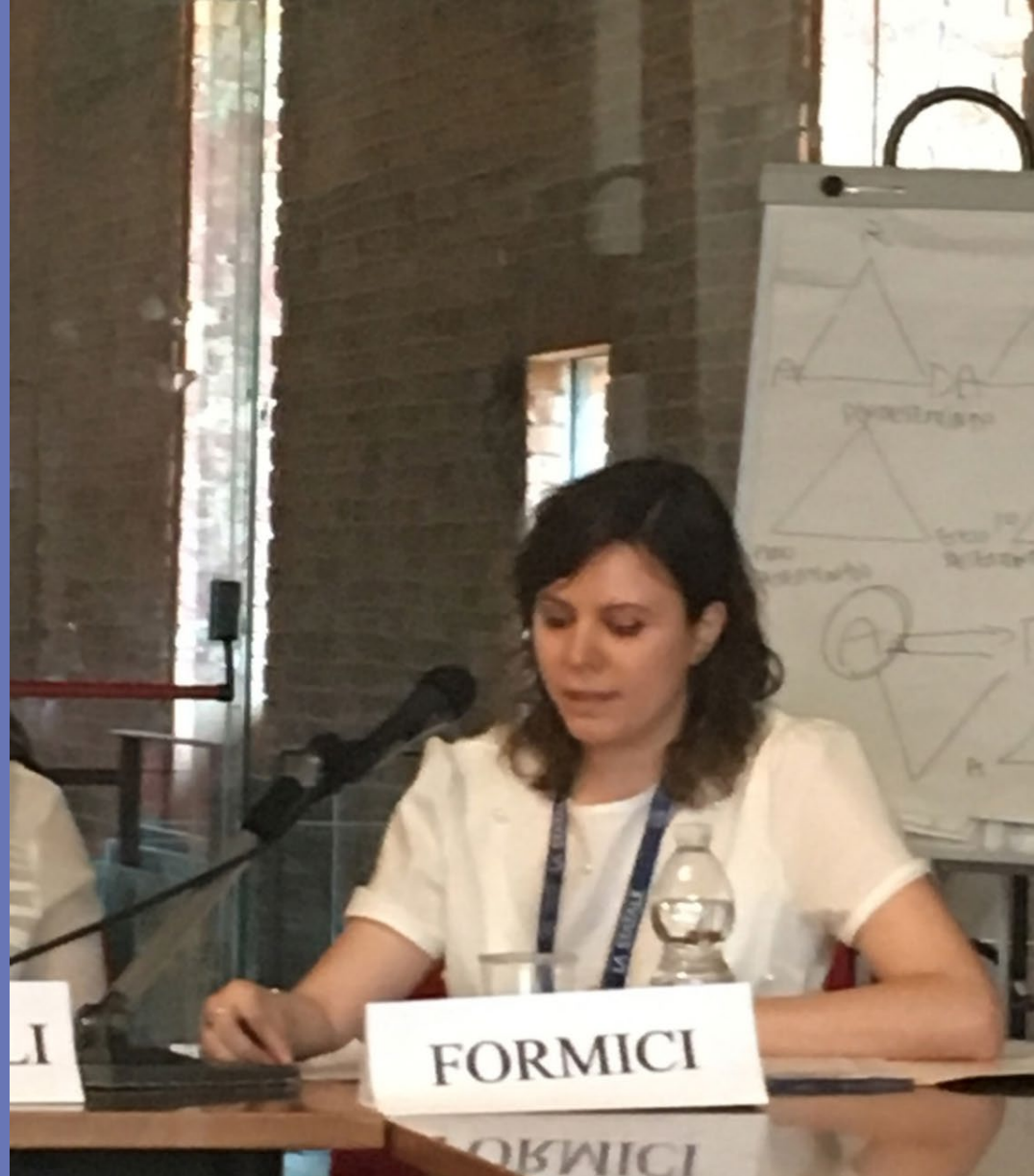
Giulia Formici , « The External Dimension of the European Rule of Law in the Digital Age: An Analysis through the Looking Glass of the ECJ Case-law on Data Transfer », Université de Milan