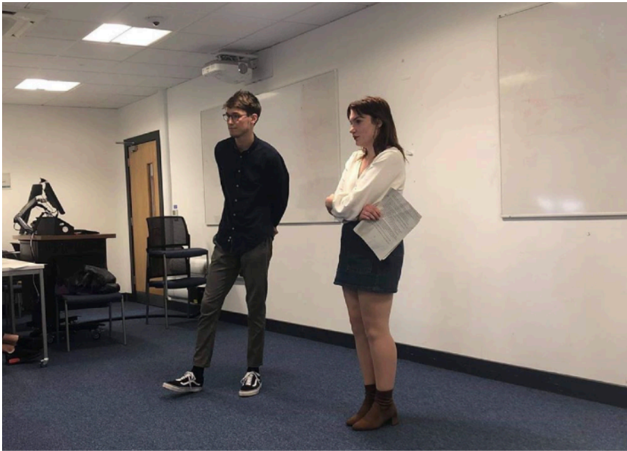
Concours d'éloquence 2019, organisé à l'initiative d'un étudiant de la promotion 2018/2023 du Double Diplôme