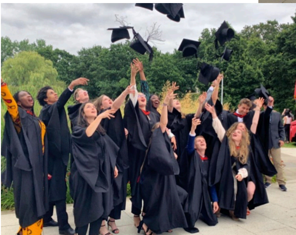
Graduation de la Promotion 2015/2019 du Double