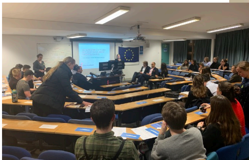
Conférence organisée par des étudiants (2018)