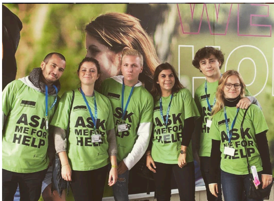
Des étudiants du Double Diplome participant aux portes ouvertes de l'Université (2016)