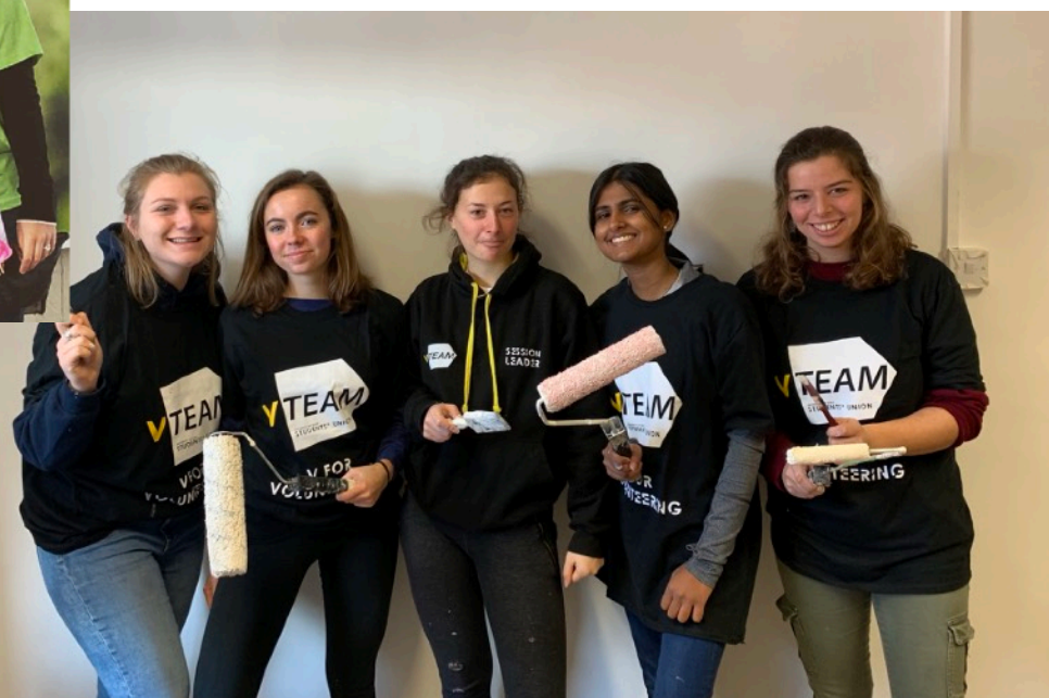
Volontariat Vteam pour quelques étudiants du Double Diplome ! (2019)