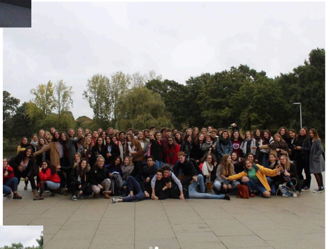
Promotion 2018/2021 et 2019/2022 du Double Diplôme